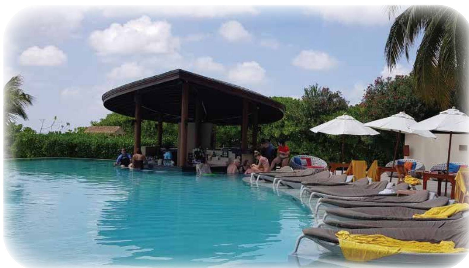
Waves Pool Bar