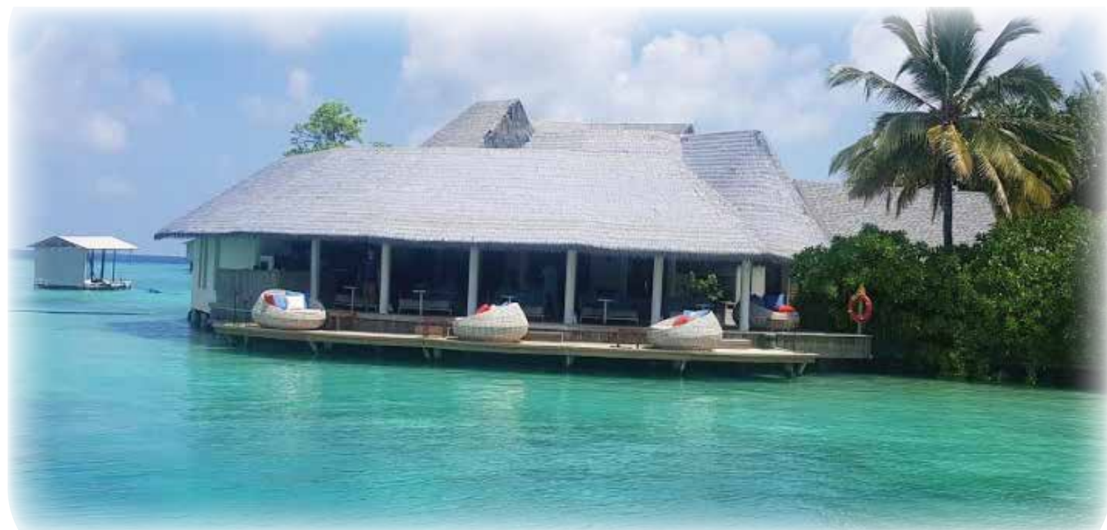
Giraavaru Lobby Bar